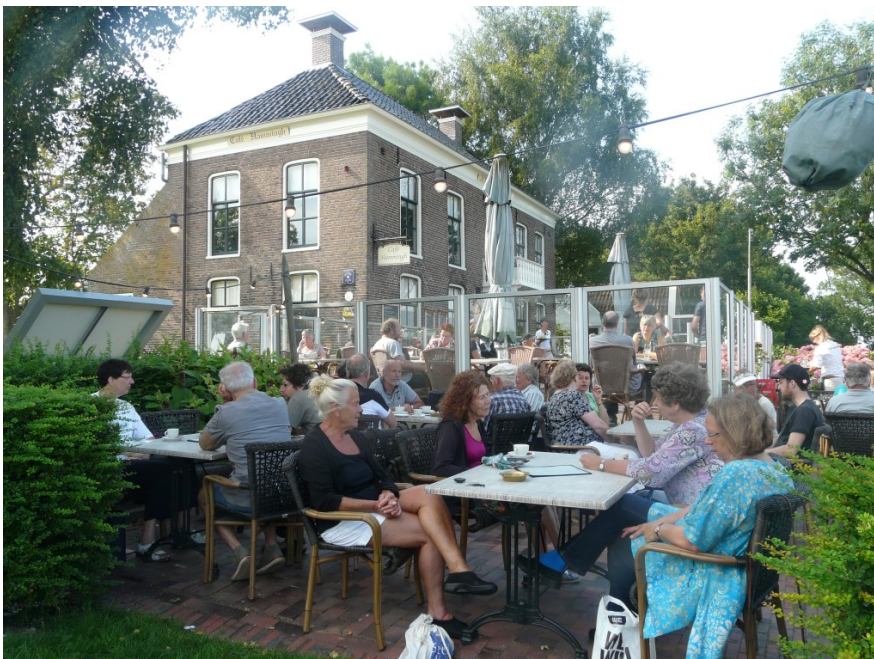
Op het terras van Café Hammingh