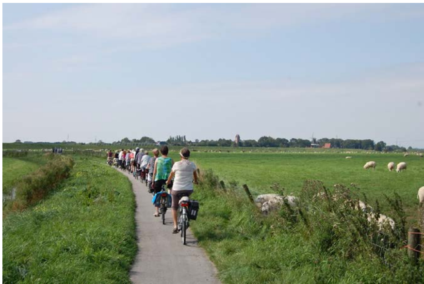
Op weg naar Garnwerd