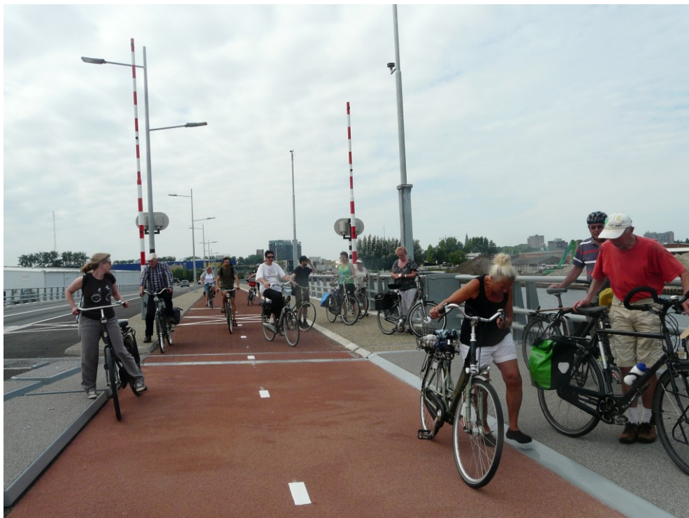
De brug wordt bewonderd